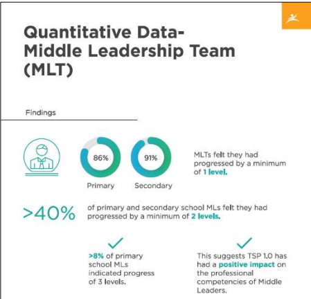
Trust Schools Programme 最明显影响中层领导者的专业竞争能力。

The Impact Study 结果以调查问卷、访谈和观察混合方法进行，并且涵盖 3,000 多名受访者(包括学校教职员、学生和家 长)。调查结果显示，95% 中学教师和 76% 小学教师在评估方面至少上升了 1 级，例如从开始 (Starting) 上升至发展 (Developing) 级别，或从增强 (Enhancing) 上升至扩展 (Extending) 级别。一个级别的变化显示出知识、技能、思维、教育方式和实践水平的范式转变。在许多情况下，专业人士甚至可能在整个职业生涯中都未曾经历过一个级别的转变，因为级别的上升取决于持续自我反思和成长思维。