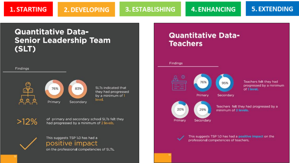
LeapEd 的 TSP 1.0 Impact 调查报告显示，此计划整体在教师专业竞争能力方面产生正面积积极影响，学生们认为他们具备高水平的教学质量。